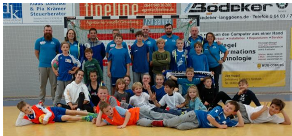
Wir hatten viel Spaß beim TAG DES HANDBALLS am 26.10.19

Am kommenden Sonntag den 03.11.2019 möchten die Jungs in ihrem Heimspiel um 15:30 Uhr in Holzheim ihren nächsten Sieg gegen die TG Friedberg verbuchen.