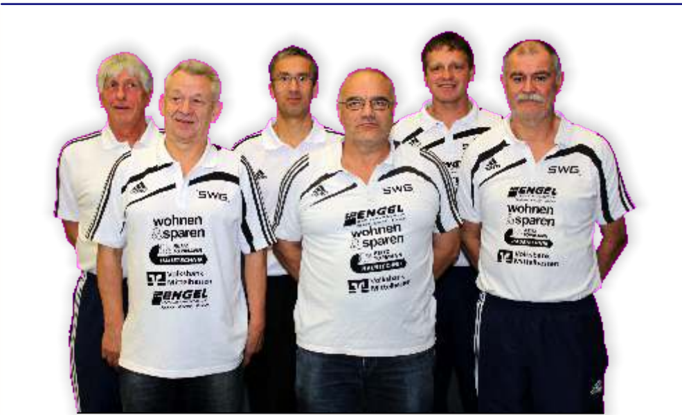
Trainer- und Betreuer team der 1. Männermannschaft